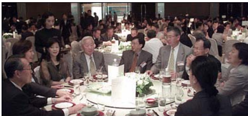
台灣玉山年會 (2002 年 6 月)