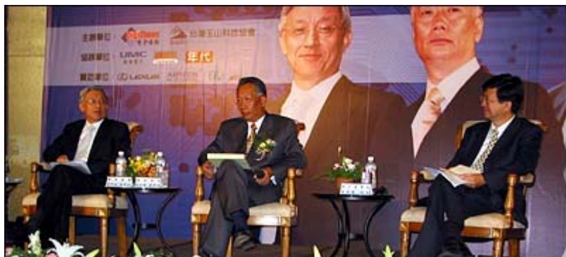
「台灣資訊電子產業新方向」研討會 (2002 年 8 月)